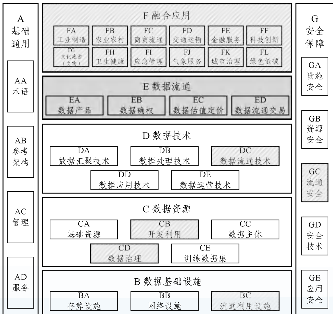
图1 数据标准体系结构图

前期，根据数据领域标准化整体情况的研究，初步形成了数据标准体系结构图，如图1所示，从基础通用、数据基础设施、数据资源、数据技术、数据流通、融合应用、安全保障等方面划分了数据标准化工作。