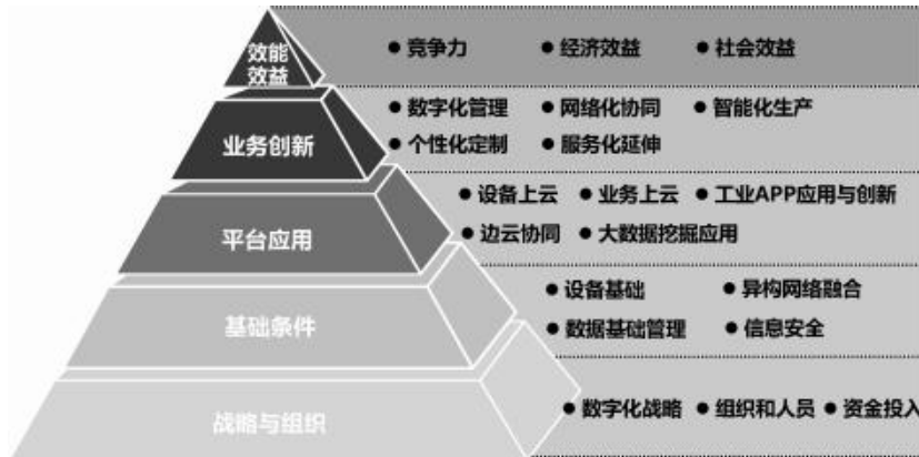
图 1 工业互联网平台应用水平与绩效评价框架